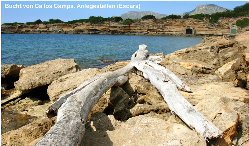
Bucht von Ca los Camps. Anlegestellen (Escars)

MATERIAL (OBLIGATORISCH): Getränke, Essen, sportliche Kleidung, Sportschuhe