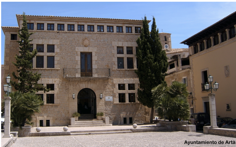
Ayuntamiento de Artà

La ruta empieza en el centro de Artà, en la plaza del Conqueridor, en dirección a Canyamel. Los 6 primeros kilómetros transcurren por una carretera totalmente llana. Al llegar a la rotonda, debe cogerse el desvío hacia Son Servera por el collado del Vidrier, de 1,1 kilómetros de subida, hasta el km 7,3. Entre el km 14,5 y el 15,2, la carretera vuelve a subir hasta el collado de la Gravera de Son Servera.