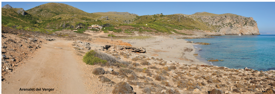
Arenalet del Verger